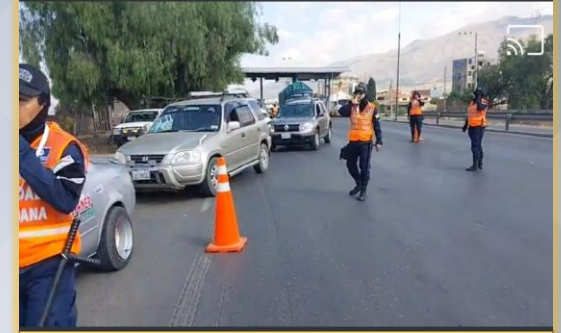
CONTROL TRAFICO Y VIALIDAD