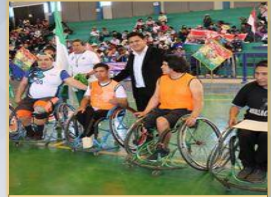
JUEGOS DEPORTIVOS ESPECIALES