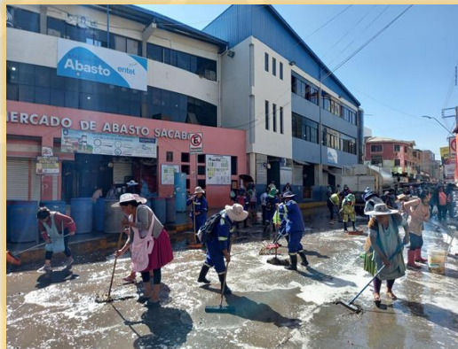
LIMPIEZA DE MERCADOS