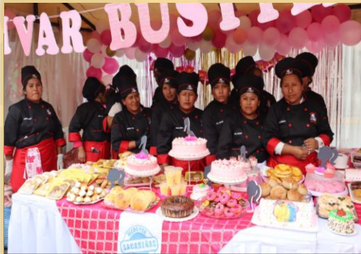
CAPACITADAS EN REPOSTERIA