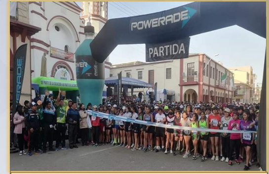
CARRERA PEDRESTE 10K