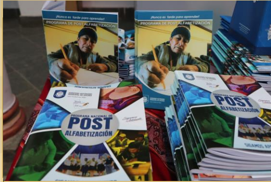
PARTICIPANTES DEL PROGRAMA POST-ALFABETIZACIÓN.