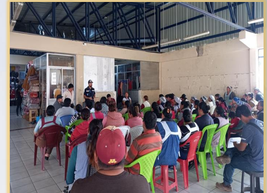
CAPACITACION BUENAS PRACTICAS DE HIGIENE