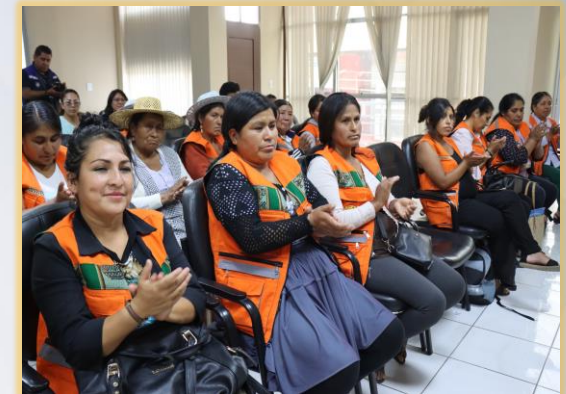
CAPACITACIONES CON PROMOTORAS