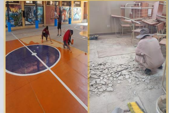
CAMBIO DE PISOS CERAMICOS EN AULAS- PINTADO DE CANCHAS