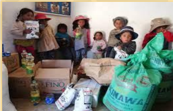
DISTRIBUCIÓN DE ALIMENTOS