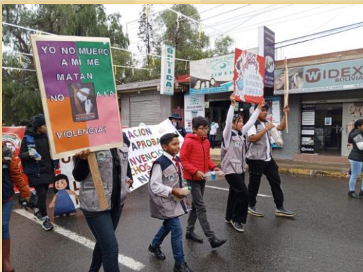
MARCHA CONTRA LA VIOLENCIA