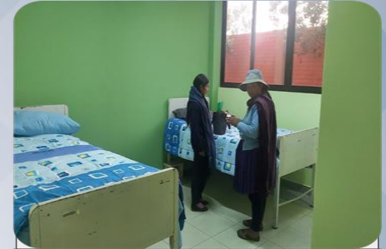
CENTRO DE ACOGIDA TEMPORAL