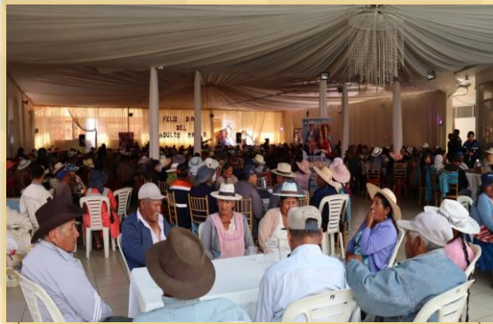
26 DE AGOSTO EL DÍA DE LA DIGNIDAD DE LAS PERSONAS ADULTAS MAYORES.