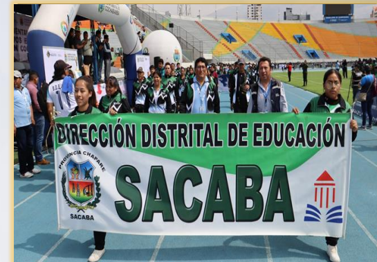
JUEGOS DEPORTIVOS ESTUDIANTILES