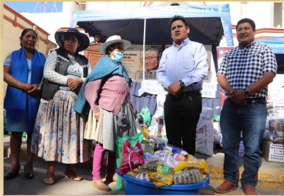
CAMPAÑA "SACABA SOLIDARIA DE CORAZÓN"