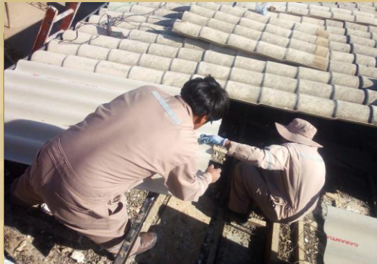
MANTENIMIENTO Y CAMBIO DE CUBIERTAS, LIMPIEZA DE CANALETAS