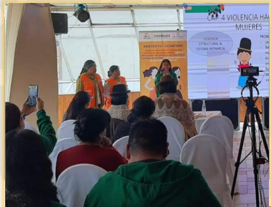
CUMBRE DE LA MUJER