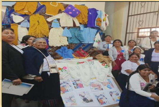
TRABAJOS REALIZADOS POR LAS COMPAÑERAS DE POS-ALFABETIZACION.