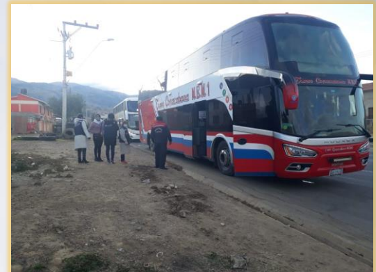
CONTROL DE PERMISOS DE VIAJE