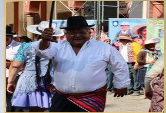
15 JUNIO DE TOMA DE CONCIENCIA DEL ABUSO Y MALTRATO EN LA VEJEZ.