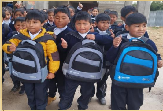
PROGRAMA MI PRIMERA MOCHILA