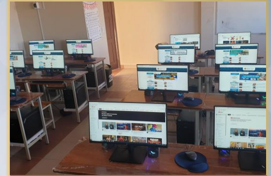
SERVICIO DE INTERNET