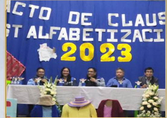
ACTA DE CLAUSURA – POS-ALFABETIZACION