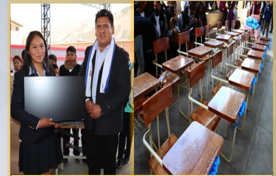
EQUIPO DE COMPUTACION Y MOBILIARIO