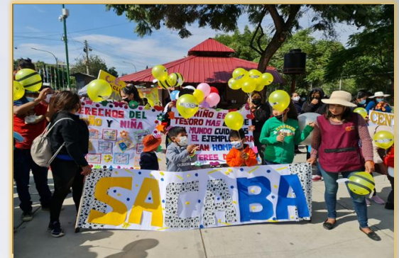
TALLERES Y FERIAS