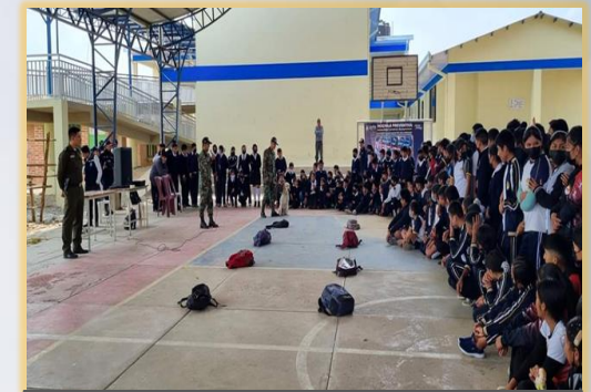
PREVENCIÓN EN UNIDADES EDUCATIVAS