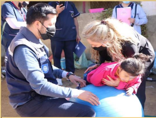
ATENCIÓN CON EL PROGRAMA R.B.C. A PERSONAS CON DISCAPACIDAD