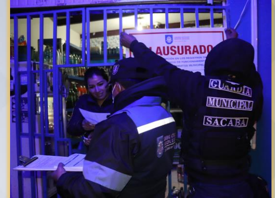
OPERATIVOS DE CONTROLES DE EXPENDIO DE BEBIDAS ALCOHOLICAS