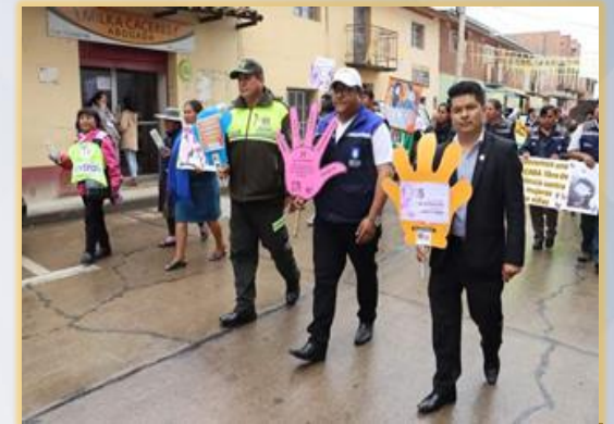
ACTIVIDADES POR EL DIA DE LA MUJER