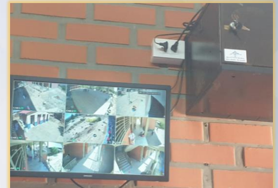
SISTEMA DE VIDEO VIGILANCIA