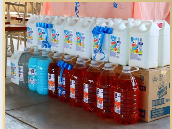
MATERIAL DE LIMPIEZA