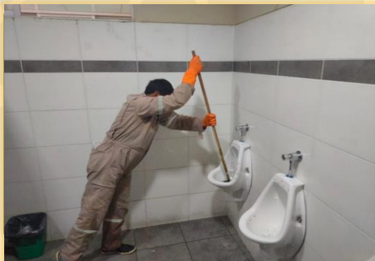
DESTAPADO DE INODOROS Y URINARIOS