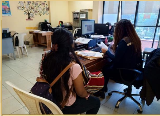
ATENCION DE DENUNCIAS