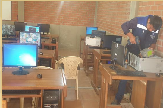
SALAS DE COMPUTACIÓN