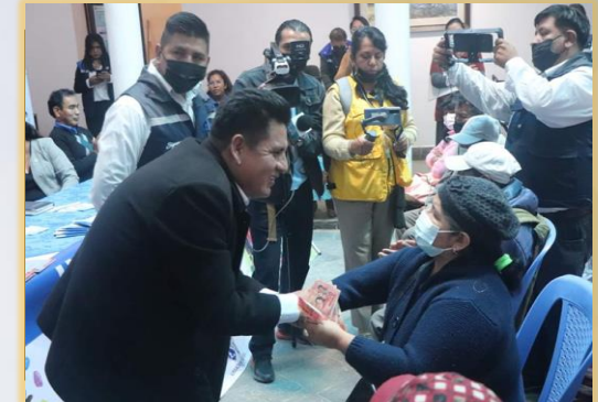
PAGO MENSUAL DEL BONO DE DISCAPACIDAD GRAVE Y MUY GRAVE