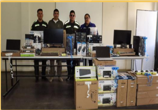
ENTREGA DE EQUIPAMIENTO