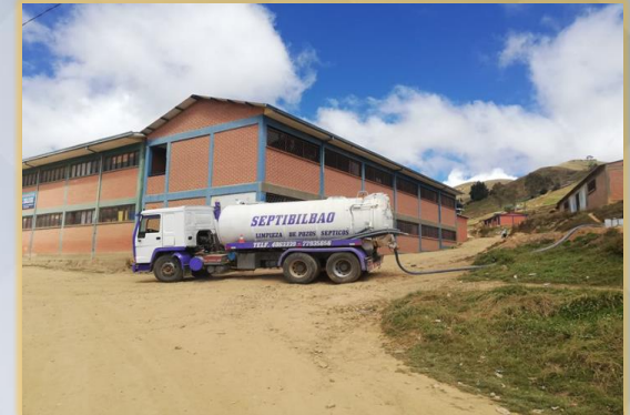
LIMPIEZA DE POZOS SEPTICOS