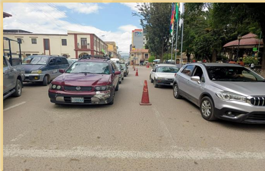
CIERRE DE VIAS