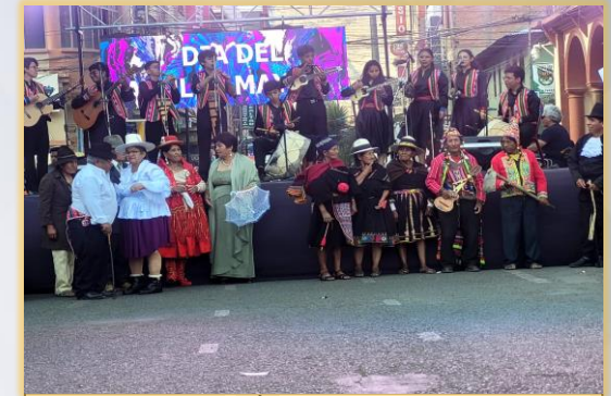
1 DE OCTUBRE "DÍA INTERNACIONAL DE LAS PERSONAS ADULTAS MAYORES".