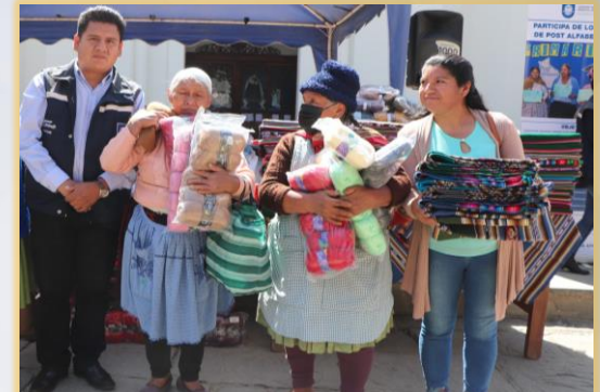
ENTREGA DE MATERIAL PARA TEJIDO y COSTURA