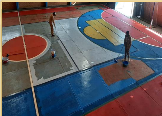
MANTENIMIENTO DE CAMPOS DEPORTIVOS