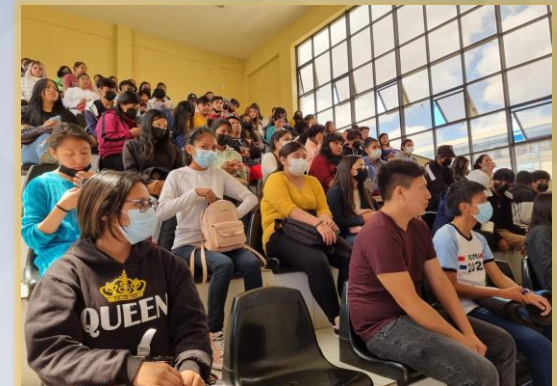
CAPACITACIONES A JOVENES