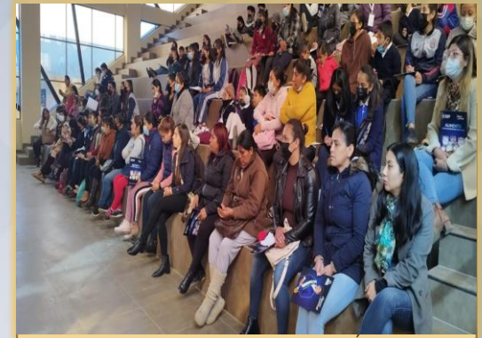
TALLER DE CONCIENTIZACIÓN DE ALIMENTO COMPLEMENTARIO ESCOLAR