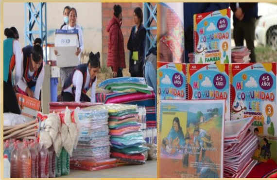
ADQUISICIÓN DE MATERIAL DIDÁCTICO LÚDICO Y MATERIAL DE LIMPIEZA PARA LOS CENTROS INFANTILES UAIN@.