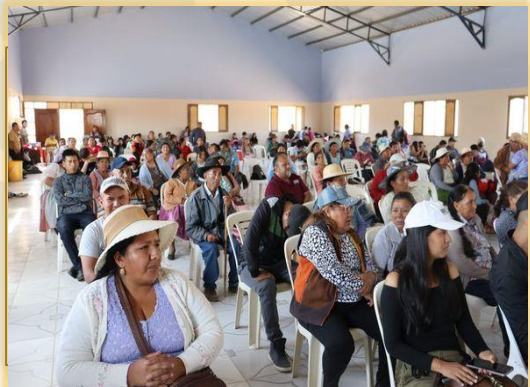
TALLERES CONTRA LA VIOLENCIA