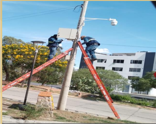
SISTEMA DE VIDEO VIGILANCIA