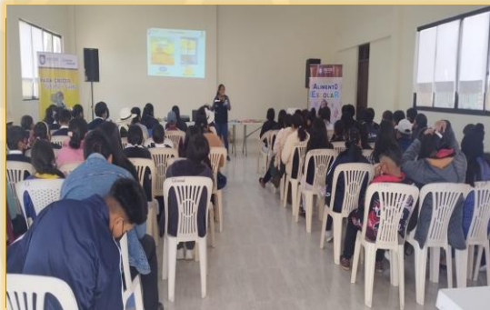
TALLER DE CONCIENTIZACIÓN DE ALIMENTO COMPLEMENTARIO ESCOLAR