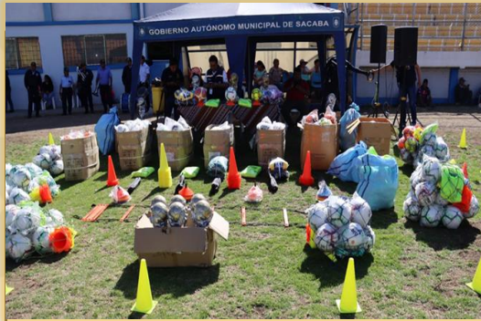
ENTREGA DE MATERIAL DEPORTIVO.