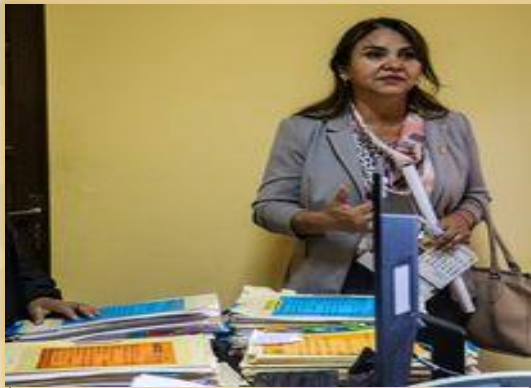
REGISTRO DE DENUNCIAS