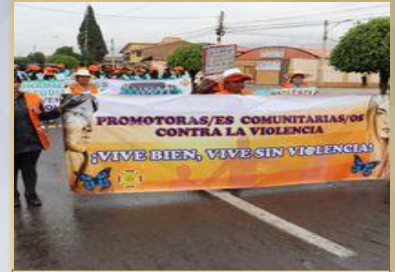
MARCHA POR EL DIA DE LA MUJER