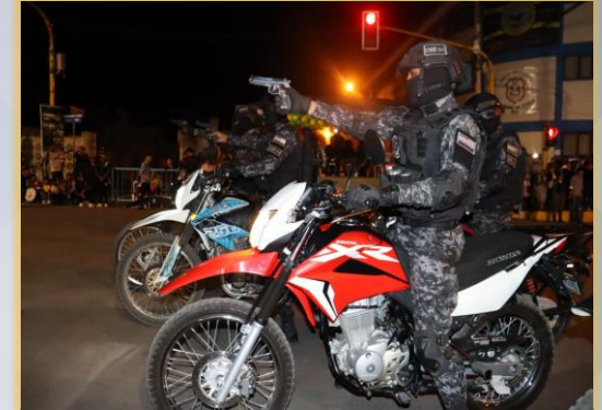
PATRULLAJES DE PREVENCIÓN