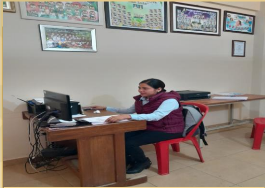
CONSULTORES INDIVIDUALES DE LÍNEA SECRETARIAS/OS