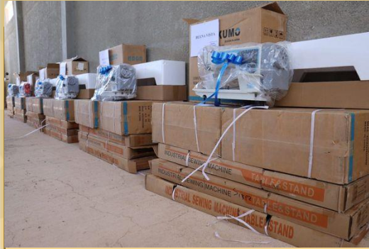
EQUIPAMIENTO PARA CENTROS DE GENERO