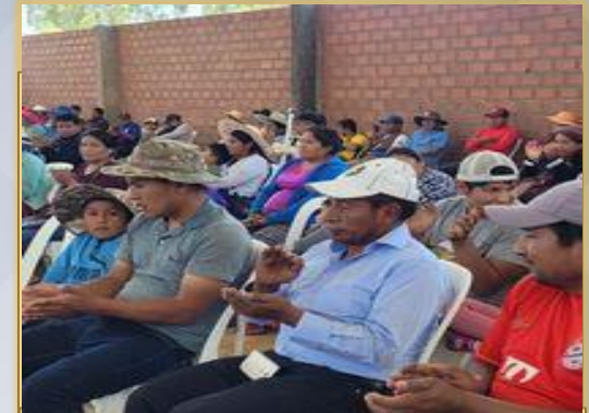
TALLER CONTRA LA VIOLENCIA